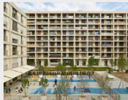
Lot A du quartier de l'Adret à Lancy, Tribu architecture, MO: FCLPA + FCIL

« 4 à 7 » d'EspaceSuisse - Section romande, visite du quartier Adret Pont-Rouge - Grand-Lancy, GE, 14 septembre 2021. Des informations suivront sur le site de l'association : espacesuisse-romande.ch