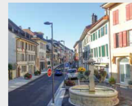
La Sarraz VD (photo : A. Beuret, EspaceSuisse).

Séminaire. Avec la nécessité de développer le milieu bâti vers l'intérieur, l'ISOS, l'Inventaire fédéral des sites construits d'importance nationale à protéger en Suisse, a beaucoup gagné en importance ces dernières années. Organisé en collaboration avec l'Office fédéral de la culture (OFC), le séminaire présente l'ISOS, montre quel peut être son apport en faveur d'une densification de qualité et se penche sur le champ de tension qui existe entre protection et renouvellement.