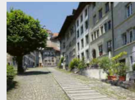
Escaliers du Court-Chemin, Fribourg.

Cours. La nouvelle loi sur l'aménagement du territoire exhorte la Confédération, les cantons et les communes à favoriser l'urbanisation vers l'intérieur et à privilégier la qualité. Les conseillers communaux, de même que les employés des services communaux et cantonaux, ont à prendre des décisions ayant des conséquences sur la cohabitation, la qualité de vie et les finances des communes. Organisé en collaboration avec les services cantonaux concernés, ce cours sera axé sur les spécificités cantonales.