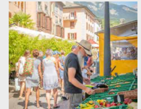
Marché de la Vieille Ville de Sion (© Guanzini Photographie).

Séminaire et Assemblée générale. L'approvisionnement alimentaire et l'alimentation jouent un rôle prépondérant dans nos vies quotidiennes et impactent fortement nos territoires de multiples façons tout en restant souvent peu abordés. Ce séminaire entend apporter un éclairage multi-orienté et dresser les perspectives dans une vision durable.