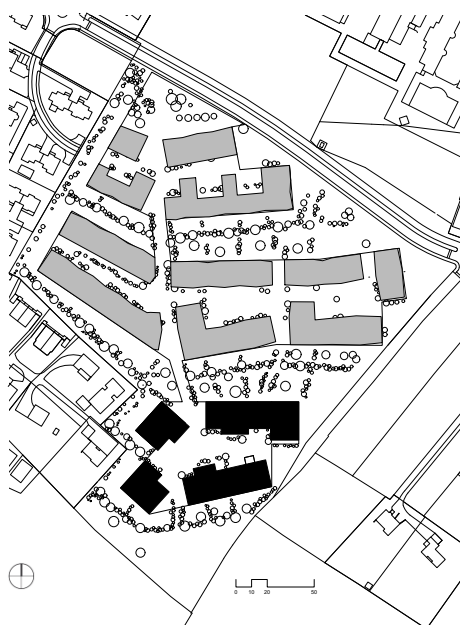
Plan de situation