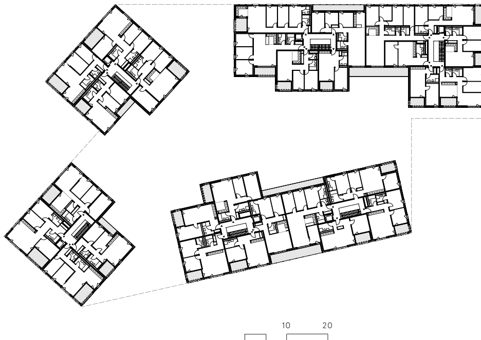
Plan d'un étage intermédiaire