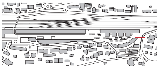
Intégration au sein du quartier Ecoparc