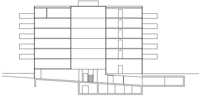
COUPE TRANSVERSALE | UNE RAMPE LÉ- GÈREMENT INCLINÉE RELIE LE GARAGE AU PARC ET AUX ENTRÉES DES DIFFÉRENTS BÂTIMENTS