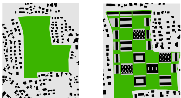
Définition des structures bâties optimales