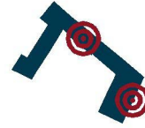
Schema Doppelpunkt. Kultur und Gesundheit